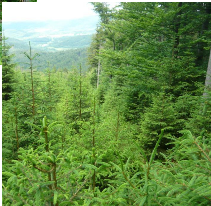
Nahoře foto z roku 2009, vpravo tatáž porostní skupina foto z r. 2016

Zpracoval ÚHUL, pobočka Plzeň na základě projednání na MZe a zpracování připomínek z 23. 11. 2017